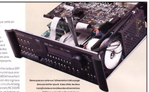
Remarque sur cette vue l'alimentation à découpage dans une batterie d'abord. Il est évident, les deux transformateurs toroïdaux des alimentations dédiées aux circuits audio analogiques.

Cet ensemble permet tout ou presque. Parfaitement adapté pour traiter au mieux toutes les sources audio et audio-vidéo, il faut désormais compter avec parmi les systèmes home cinéma de référence.